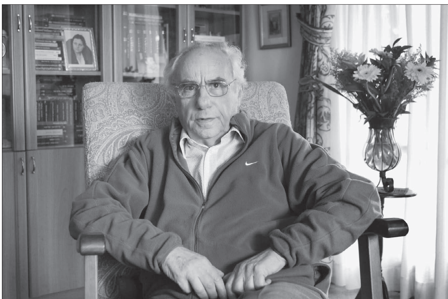
חוקי השואה. פרופ' צבי בכרך, יליד הנוא, גרמניה, שרד בתקופת השואה ארבעה מחנות: ווסטרבורג, טרזינשטט, אושוויץ וטאוכה. החל את דרכו האקדמית כחוקר אנטישמיות והתמקד בחקר תורת הגזע ובאידאולוגיה הנאצית. "ניסיתי להבין את הצד של הרוצח, כי את הקורבן הבנתי מתוך החוויה האישית. עדיין, אחרי יותר מ-20 שנות מחקר, קשה לי להבין את המניעים של המשטר הנאצי". חקר ולימד באוניברסיטת בר אילן. לפני כמה שנים ערך את הספר "אלה דברי האחרונים" (יד ושם) בו נאספו מכתבים אחרונים מן השואה. בכרך: "אני מתעל את האמוציות, הצער והכעס לתוך המחקר, כמובן תוך שמירה על כללי המחקר האקדמי. העיסוק במחקר השואה מאזן אותי"