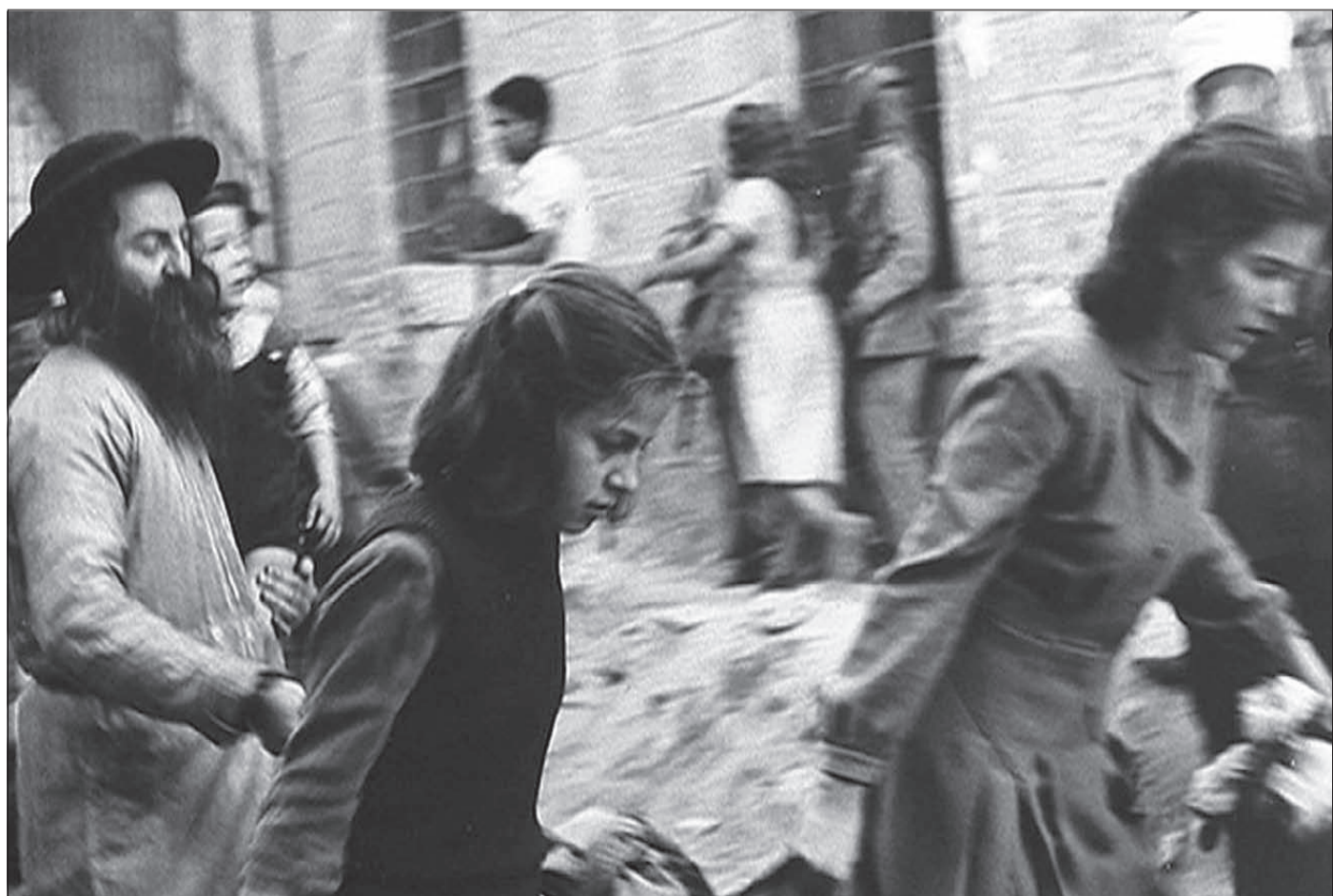
מאי 1948, היהודים עוזבים את הרובע היהודי בירושלים. אחת התמונות מתוך הסרט התיעודי "ירושלים, ג'רוזלם" אל קודס", שיוקן מחר בפסטיבל דוקאביב 2008. אם אתה מזהה את עצמן בתמונה, אנא העבר מייל אל letters@yedioth.co.il