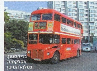
בריקסטון אקלקטית במלוא המובן

כאן שכרתי את הדירה הראשונה שלי בלונדון, ולמדתי בפעם הראשונה שאפשר למצוא חתן בסופרמרקט, TESCO במקרה הזה - הוא עדיין שם (הסופרמרקט, לא החתן) ועדיין מהווה קרקע פורייה לפיק-אפ מכל הסוגים, בשכונה הכי אקלקטית שיש: קשוחה ויפית, אלימה וגיי פרנדלית, נחשלת וטרנדית, הכל בכל מכל לכל. גולות הכותרות, מעבר לנוסטלגיה הפרטית: שוק אפרו-קאריבי מגניב לגמרי באלקטריק אוונוי - כשם להיטו המיתי של אדי גרנט - שכמו בריקסטון עצמה גם בו יש הכל, מאגוזי קוקוס ובובות ברבי שחורות ועד תיקי לואי ויטון מזויפים בכישרון; קולנוע ריצ'י הנהדר, שאפשר להתכרבל בו בימי גשם למרתונים של סרטים טובים, ישנים כחדשים; הברי-קסטון אקדמי, היכל הרוק הפיצוצי, שמארח את מיטב הלהקות והאמנים.