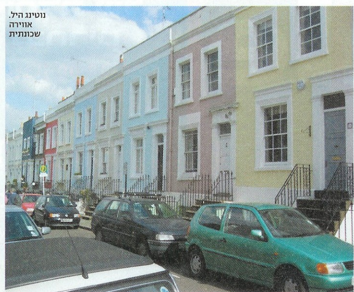
נוטינג היל אווירה שונותית

או לפחות להתעורר, לבקר או סתם לשרך רגליים ברחובותיהן. מדריך מסלולים מיוחד למשוטטים שצמאים לריגושים חדשים בחוצות הבירה האנגלית