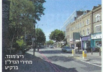
ריצ'מונד מחירי הנדל"ן בריק